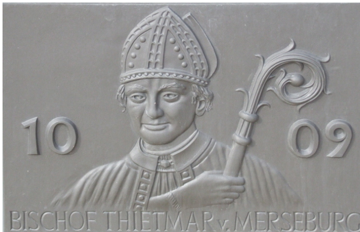
Abb. Darstellung des Bischofs Thietmar von Merseburg auf dem Stadtbrunnen in Tangermünde von Karolin Donst 2

Die Ersterwähnung von Pausitz im Jahre 974 findet sich in der Chronik des Bischofs Thietmar von Merseburg (976-1018). Der aus dem sächsischen Hochadel stammende Grafensohn war als Drittgeborener für die geistliche Laufbahn vorgesehen. Nach dem Tod des Merseburger Bischofs Wigbert wurde er 1009 dessen Nachfolger, welches Amt er bis zu seinem Tod ausübte. Bereits früh war Thietmar literarisch tätig. Insbesondere gilt er als einer der größten Geschichtsschreiber seiner Zeit. Eine große Bekanntheit erlangte er durch seine Chronik, die er um 1012 begann. Sie war wohl als Geschichte des Bistums Merseburg angelegt. Da diese aber eng mit der Geschichte des sächsischen Herrscherhauses verbunden war, reicht die Chronik mit ihren Inhalten weit über das Merseburger Gebiet hinaus. Sie reflektiert den Zeitraum von 918 bis 1018 und beinhaltet frühe Erwähnungen nicht weniger Orte auch im muldenländischen Raum. 1